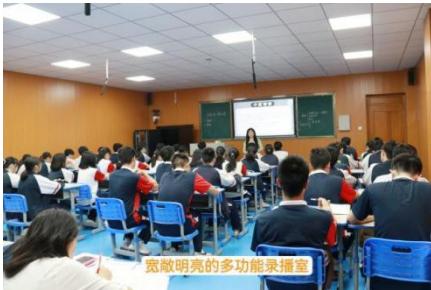
宽敞明亮的多功能录播室